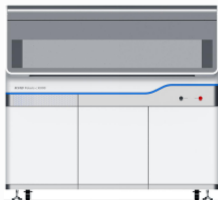
样本提取及体系构建