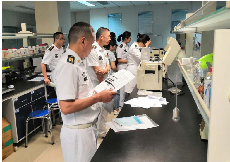
2019年7月，在北京军事科学院培训 BBS926设备，共采购7台926设备