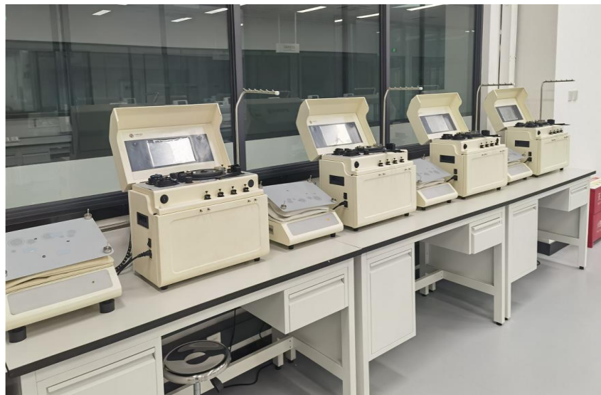
成都血液中心安装BBS926